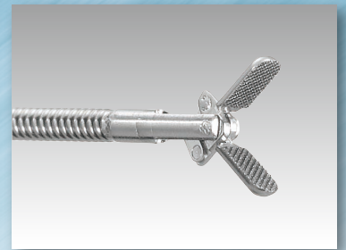
把持鉗子「セルメンHK1.2」