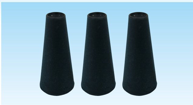
シリコンカバー3個付属