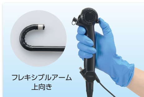
フレキシブルアーム 上向き