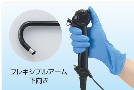
フレキシブルアーム 下向き